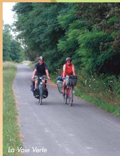
La Voie Verte

Pays de Châteaubriant www.aupaysdechateaubriant.com