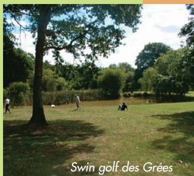
Swin golf des Grées

Parcours 10 trous aménagé à l'anglaise dans un cadre préservé. Location de VTT, tir à l'arc et paint-ball pour les groupes. Café jardin et chambres d'hôtes. Rens. Office de Tourisme.