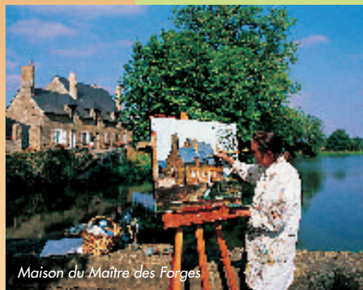
Maison du Maître des Forges

Le sentier sillonne d'abord dans les sous-bois de chênes et de hêtres puis